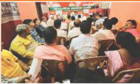
ভারতীয় জনতা পার্টির মেদিনীপুর জেলার কার্যকর্তাদের সঙ্গে সাংগঠনিক বৈঠকে রাজ্য ও জেলা নেতৃত্ব।