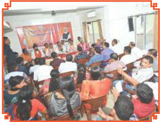
কোচবিহার জেলার সিতাই বিধানসভার সাংগঠনিক সভায় কেন্দ্রীয়, রাজ্য ও জেলা নেতৃত্ব।