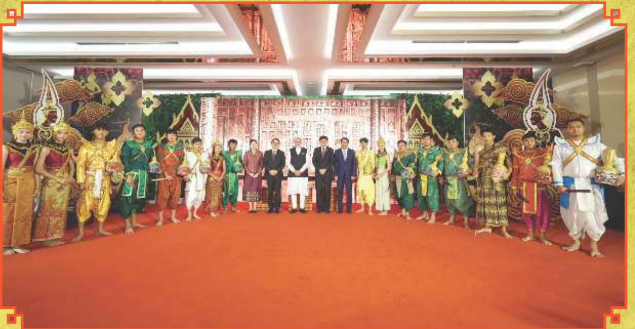
লাওসে রয়্যাল থিয়েটার অফ লুয়াং প্রাবাং অভিনীত রামায়ণের স্থানীয় সংস্করণ 'ফ্রা লাক ফ্রা রাম' শিল্পীদের সঙ্গে প্রধানমন্ত্রী নরেন্দ্র মোদী।