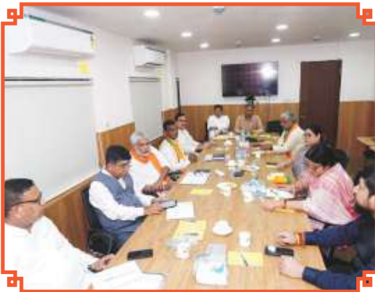
রাজ্য বিজেপি কার্যালয়ে কোর কমিটির বৈঠকে কেন্দ্রীয় এবং রাজ্য নেতৃত্ব।