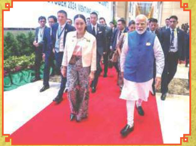
পূর্ব এশিয়া শীর্ষ বৈঠকের ফাঁকে থাইল্যান্ডের প্রধানমন্ত্রী শ্রীমতি পেতংতান সিনাওয়াত্রার সঙ্গে সাক্ষাৎ ও প্রথম বৈঠক প্রধানমন্ত্রী শ্রী নরেন্দ্র মোদীর।