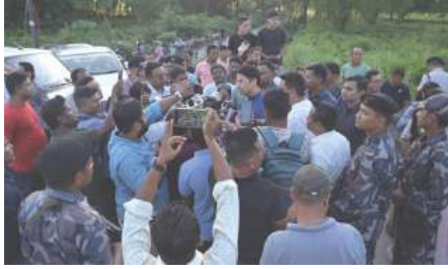
জয়গাঁও-তে নাবালিকাকে ধর্ষণ করে খুনের অভিযোগ। নির্যাতিতার পরিবারের সঙ্গে দেখা করতে গিয়ে পুলিশি বাধার মুখে বিজেপি প্রতিনিধি দল।

শুনলে আমার মেয়ের মরদেহ সংরক্ষিত হত মানে দ্বিতীয়বার ময়নাতদন্ত হত, তাড়াহুড়ো করে দাহ করে সব প্রমাণ লোপাট করে দিতে পারত না পুলিশ-তৃণমূল-প্রশাসনা মানুষের সঙ্গে মানুষের সম্পর্ক স্থাপনে বিজেপির যে মানবিক রাজনীতি তাতে ঢাক বাজিয়ে প্রচারের প্রয়োজন হয়না। এমনিতেই সেই সত্য সামনে আসবে আসবেই আর রাজনীতিতে সবসময় সামনে দাঁড়িয়ে ক্রেডিট নিতে হবে এমনটা নয়। অনেকসময় মানুষের স্বার্থে প্রতিবাদের জোয়ারকে নদী থেকে সাগরে পৌঁছে দিতে নিঃশব্দে রাস্তা তৈরিতে সাহায্য করতে হয়। সেটাও রাজনীতি। রাজার মত মহান যে নীতি বিজেপি এই নীতিতে বিশ্বাস করে। বিজেপি জানে ব্যাটন হাতে না রেখে হাতে হাতে ছড়িয়ে দিতে হয়, সঙ্গে প্রতিবাদের ফুলকি আর অত্যাচারীর চোখে চোখে রেখে কথা বলার সাহস।