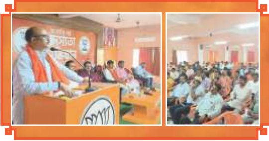
বীরভূম জেলা সদস্যতা অভিযানের কর্মশালায় রাজ্য ও জেলা নেতৃত্ব।