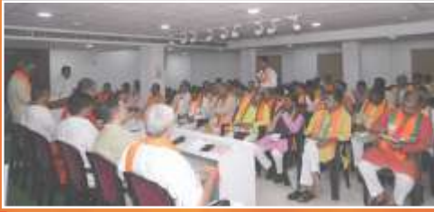
রাজ্য বিজেপি কার্যালয়ে বিশেষ সাংগঠনিক বৈঠকে কেন্দ্রীয় ও রাজ্য নেতৃত্বগণ।