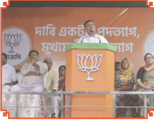
আরজি কর কাণ্ডে অভয়ার বিচার ও মুখ্যমন্ত্রীর পদত্যাগের দাবিতে পশ্চিমবঙ্গ বিজেপির ডাকে কালীঘাট চলো কর্মসূচি।