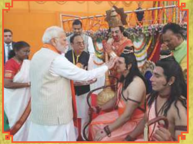
নতুন দিল্লিতে মহা বিজয়া দশমী অনুষ্ঠানে মাননীয় রাষ্ট্রপতি দ্রৌপদী মুর্মু ও প্রধানমন্ত্রী শ্রী নরেন্দ্র মোদী।