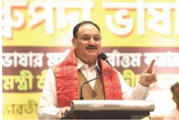
ধ্রুপদী বাংলা ভাষা নিয়ে কলকাতায় এক অনুষ্ঠানে বিজেপি সর্বভারতীয় সভাপতি জগৎ প্রকাশ নাড্ডা মহাশয়।

এর পরবর্তী সময়ে এসেছে আরেক বিজাতীয় বিদেশি রাজনৈতিক মতবাদ যা বিদেশে পরিপুষ্ট, বিদেশের মুখাপেক্ষী, বিদেশের আদর্শে আদর্শায়িতা দুটি বিদেশি রাষ্ট্র তাদের একমাত্র আদর্শ; ভারতীয়ত্বকে নিরন্তর অপমান ও হেয় করাই তাদের একমাত্র লক্ষ্য। কিন্তু তাদের আদর্শ রাষ্ট্রেই আজ তাদের মতবাদ পরিত্যক্ত। এই ব্যর্থ রাজনৈতিক মতবাদ বর্তমানে সারা পৃথিবীতে পরিত্যাজ্য হয়েছে। তারা যতই তাদের পরিভাষানির্ভর, বাস্তব মতের সপক্ষে ওকালতি করে, ততই তাদের