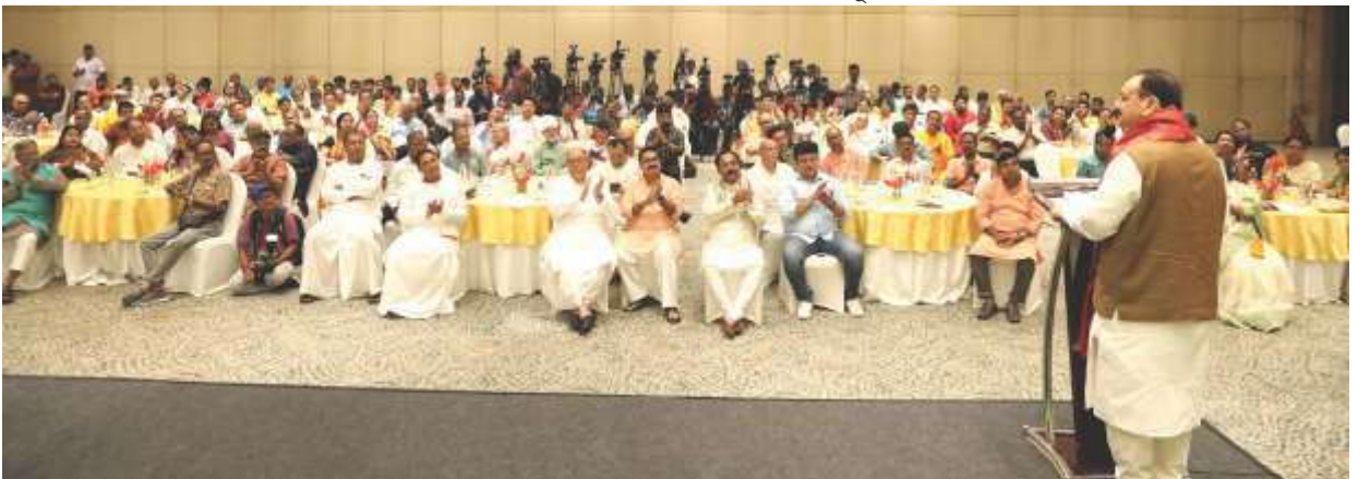
বাংলা ভাষা চর্চা নিয়ে কলকাতায় গুনীজন সানিধ্যে জেপি নাড্ডা।

২০০৪ সালে প্রথম তামিল ভাষাকে ধ্রুপদী ভাষার স্বীকৃতি দেওয়া হয়। সে সময় ধ্রুপদী ভাষা নির্বাচনের ক্ষেত্রে যে মানদণ্ডগুলি রাখা হয়েছিল সেগুলি ছিল এরূপ: সহস্রাব্দিক বছরের প্রাচীন নিদর্শন, কয়েক প্রজন্ম ব্যাপী মান্যতা প্রাপ্ত প্রাচীন সাহিত্যের গুরুত্বপূর্ণ ঐতিহ্য, নিজস্ব সাহিত্যিক পরম্পরা যা অন্য কোন ভাষা গোষ্ঠীর কাছ থেকে ঋণকৃত নয়। ২০০৫ সালে শর্তাবলী খানিকটা পরিবর্তিত হয়; ভাষার প্রাচীন নিদর্শনের প্রাচীনত্বের