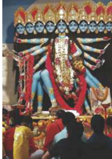
বিপ্লবীদের হাত ধরেই শুরু মালদার দশ মাথা কালী পূজা।

বাংলায় প্রথম কে কালীপূজা প্রবর্তন করেন সেবিষয়ে মতভেদ বিদ্যমান। সপ্তদশ শতকের নবদ্বীপের প্রথিতযশা তান্ত্রিক কৃষ্ণানন্দ আগমবাগীশকে বাংলায় কালীমূর্তি ও কালীপূজার প্রবর্তক মনে করা হয়। তাঁর পূর্বে কালী উপাসকগণ তাম্রটাটে ইষ্টদেবীর যন্ত্র এঁকে বা খোদাই করে পূজা করতেন। যদিও ইতিহাসে আমরা পাই, বহিরাগত মোগলদের বিরুদ্ধে বাংলার স্বাধীনতাযোদ্ধা মহারাজা প্রতাপাদিত্য কালীসাধক ছিলেন। তিনি যশোরেশ্বরী