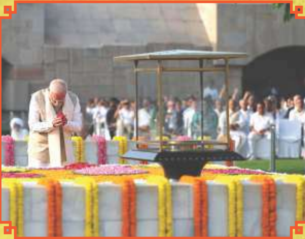
গান্ধী জয়ন্তী উপলক্ষে রাজঘাটে জাতির জনক মহাত্মা গান্ধীর সমাধিতে পুষ্পার্ঘ্য নিবেদন করছেন প্রধানমন্ত্রী শ্রী নরেন্দ্র মোদী।