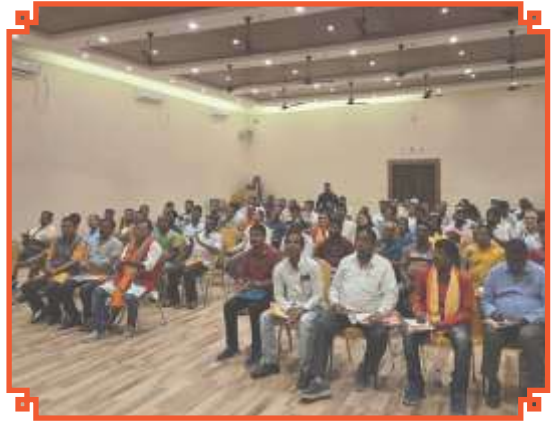
আলিপুরদুয়ার জেলার মাদারিহাট বিধানসভার সাংগঠনিক সভায় কেন্দ্রীয়, রাজ্য ও জেলা নেতৃত্ব।