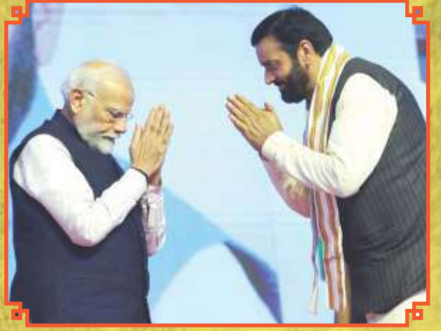
হরিয়ানায় শপথ গ্রহণ অনুষ্ঠানে প্রধানমন্ত্রী নরেন্দ্র মোদী ও হরিয়ানার দ্বিতীয়বারের মুখ্যমন্ত্রী নায়াব সিং সাইনি।