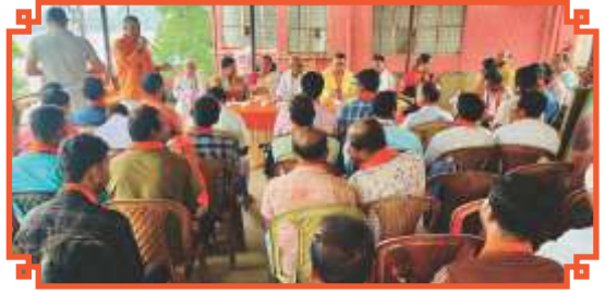
ভারতীয় জনতা পার্টি বসিরহাট সাংগঠনিক জেলার কার্যকর্তাদের নিয়ে সদস্যতা অভিযানের বৈঠকে রাজ্য ও জেলা নেতৃত্ব।