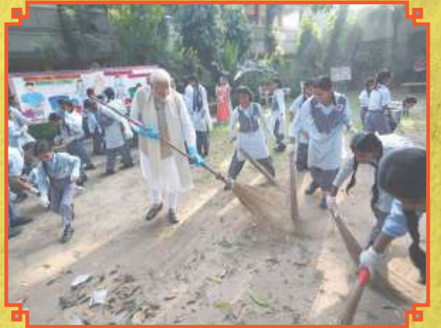
গান্ধী জয়ন্তী উপলক্ষে শিশুদের সাথে স্বচ্ছতা অভিযানে প্রধানমন্ত্রী শ্রী নরেন্দ্র মোদী।