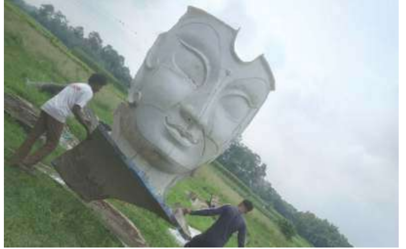
হলনা রানাঘাটে ১১২ ফুট উচ্চতার দুর্গা পূজা

সনাতনীদের নিয়ে খারাপ কথা বললেও তাঁর প্রতি মমতা ব্যানার্জির স্নেহে একটুও কমতি হয়নি। উল্টে তিনি আরো ক্ষমতাস্বার্থ হয়েছেন দিনের পর দিন। একই রকম ভাবে রাজ্যের বিধায়ক সনাতনীদের কেটে গঙ্গার জলে ভাসিয়ে দেওয়ার কথা বললেও তাঁর বিরুদ্ধে থানায় এফআইআর টুকু করা হয় না। দলগত পদক্ষেপ সেখানে অনেক দূরের কথা। বাংলাদেশে যেমন প্রকাশ্য রাজপথে মিছিল করে হিন্দু বিরোধী স্লোগান দেওয়া হয়, তেমন মালদা মুর্শিদাবাদের বিভিন্ন জায়গায় আজকাল সনাতন বিরোধী মিছিল প্রকাশ্য রাস্তায় নামতে শুরু করেছে। শুধু