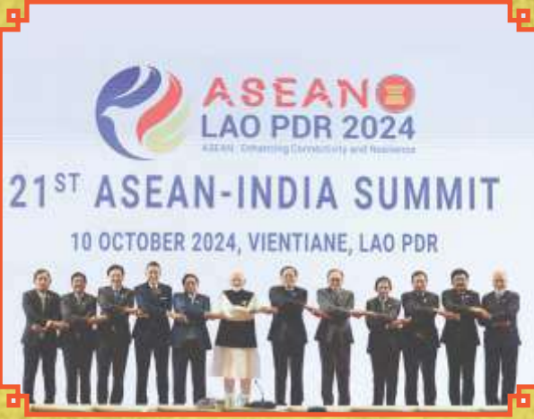
দক্ষিণ-পূর্ব এশিয়ার সঙ্গে দৌত্য মজবুত করতে এবং চিনের বিরুদ্ধে পাল্টা ভূরাজনৈতিক চাপ বহাল রাখতে দুদিনের লাওস সফরে প্রধানমন্ত্রী নরেন্দ্র মোদী।