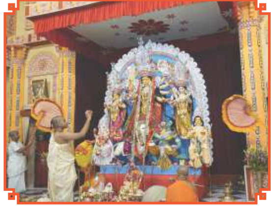
বেলুড় মঠে সপ্তমীর মহাশুভে অঞ্জলি দিচ্ছেন বিজেপিৰ সৰ্বভাৰতীয় সভাপতি শ্ৰী জে পি নাড্ডা এৰং ৰাজ্য নেতৃত্ব।