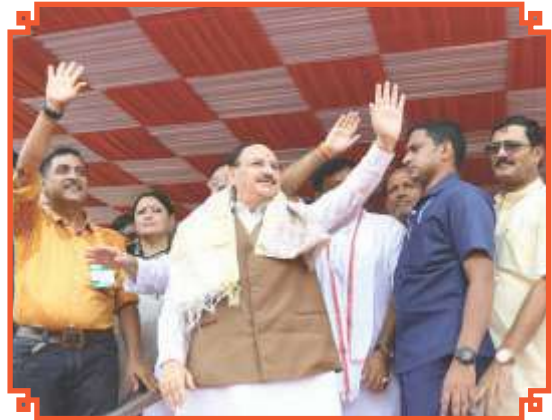
সন্তোষ মিত্ৰ স্কোয়াৰেৰ দুৰ্গাপুজোয় বিজেপি সৰ্বভাৰতীয় সভাপতি এৰং কেন্দ্ৰীয় মন্ত্ৰী শ্ৰী জে পি নাড্ডা মহাশয়।