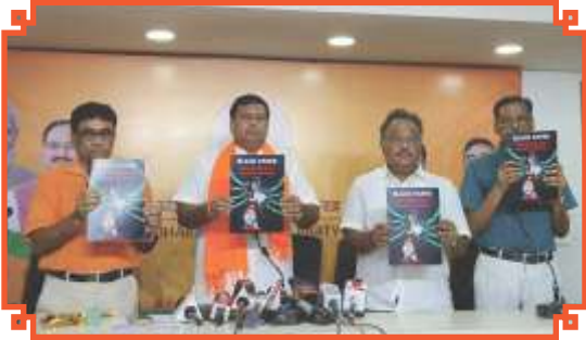
কেন্দ্রীয় প্রতিমন্ত্রী ও রাজ্য বিজেপি সভাপতি ডঃ সুকান্ত মজুমদারের নেতৃত্বে, গত ২০১১ থেকে ২০২৪ এর সেপ্টেম্বর মাস পর্যন্ত পশ্চিমবঙ্গ জুড়ে মহিলাদের উপর ক্রমাগত হিংসা, ধর্ষণ এবং অন্য সমস্ত অপরাধের বিবরণ নিয়ে পশ্চিমবঙ্গ রাজ্য বিজেপির পক্ষ থেকে প্রকাশিত হল 'ব্ল্যাক পেপার'।