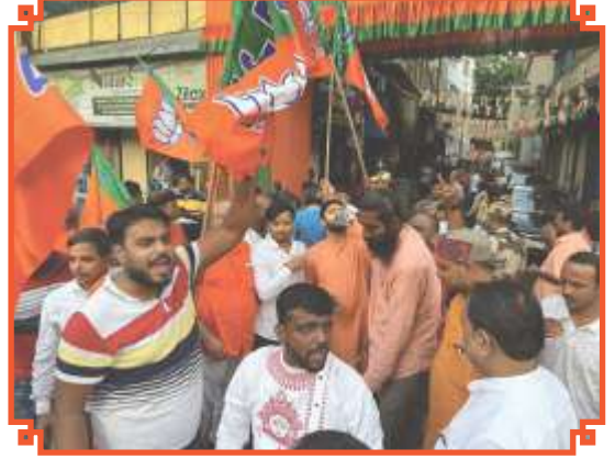
হরিয়ানা বিধানসভা নির্বাচনে ভারতীয় জনতা পার্টির বিপুল জয়ের উচ্ছ্বাস পশ্চিমবঙ্গ বিজেপি প্রদেশ কার্যালয়ে।