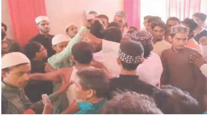
মহা অষ্টমীতে গার্ডেনরিচের নিউ বেঙ্গল স্পোর্টিং ক্লাব দুর্গামন্ডপ

আমরা সবাই প্রতিবেশী বাংলাদেশে একের পর এক মূর্তি ভাঙার ঘটনা সম্পর্কে