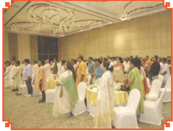
বাংলা ভাষাকে ধ্ৰুপদী ভাষা হিসেবে সম্মানিত কৰাৰ জন্যে কলকাতায় এক অনুষ্ঠানে গুণীজনদের থেকে প্রধানমন্ত্রীৰ উদ্দেশ্যে ধন্যবাদ পত্ৰ গ্ৰহণ কৰলেন বিজেপি সৰ্বভাৰতীয় সভাপতি জে পি নাড্ডা মহাশয়।