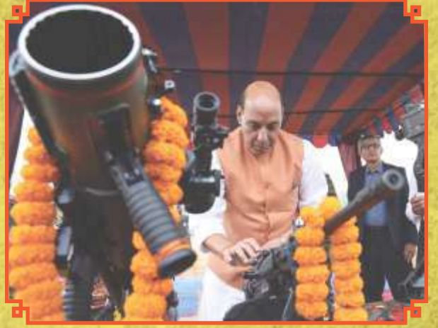
মহা বিজয়া দশমীতে দার্জিলিংয়ের সুকনা ক্যান্টনমেন্টে জওয়ানদের সঙ্গে শস্ত্র পূজনে প্রতিরক্ষা মন্ত্রী রাজনাথ সিং।