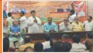
উত্তর কলকাতা জেলার সদস্যতা অভিযানের পরিকল্পনা বৈঠকে রাজ্য ও জেলা নেতৃত্ব।