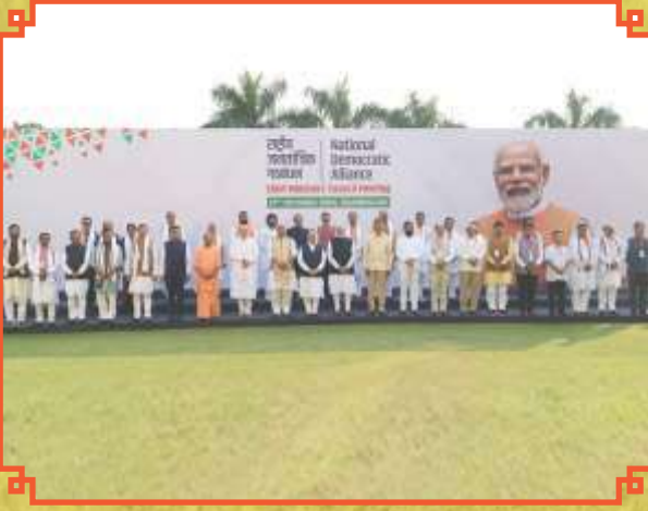
জনকল্যাণ ও সুশাসন নিয়ে জাতীয় গণতান্ত্রিক জোটের মুখ্যমন্ত্রী ও উপ-মুখ্যমন্ত্রীদের সঙ্গে বৈঠকে প্রধানমন্ত্রী নরেন্দ্র মোদী।